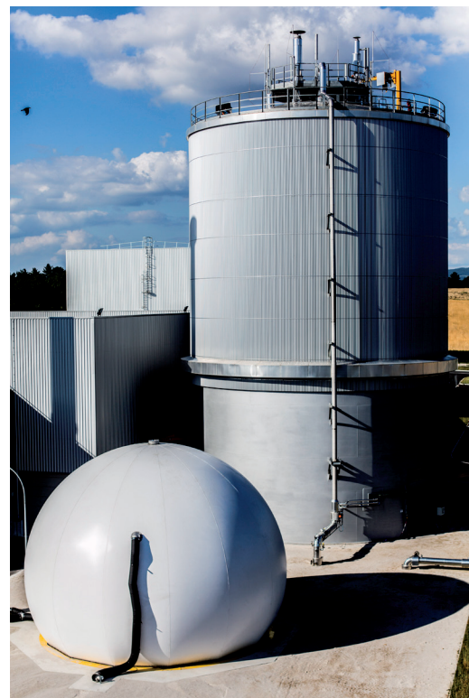
L'usine d'Organom valorise les ordures ménagères (ci-dessus le méthaniseur d'OVADE)

La communauté d'agglomération assure la collecte des ordures ménagères sur son territoire. Elles sont ensuite acheminées par camion vers l'usine OVADE, située sur le site de La Tienne à Viriat. Les déchets subissent alors une première étape de tri, qui permet d'isoler les métaux ferreux recyclables et la matière organique méthanisable. Les refus (textiles sanitaires, plastiques, verre, inertes...) sont enfouis dans le centre de stockage attendant. La matière organique est ensuite digérée dans le méthaniseur, où elle produit du biogaz qui sera transformé en électricité. Enfin, ce qui reste après digestion, le digestat, est mélangé aux déchets verts (feuilles, branchages, tontes) pour produire du compost.